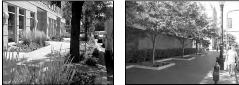
City of Evanston. Site Plan and Appearance Review Design Standards. Issued by: City of Evanston Plan Commission