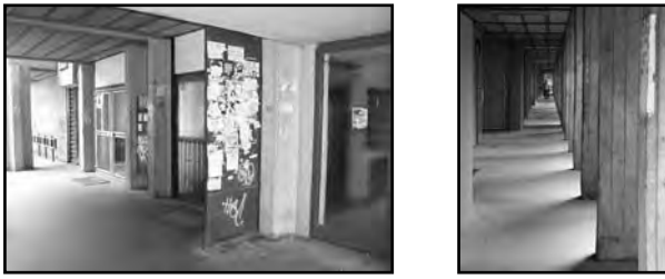
Budapest – Békásmegyér.