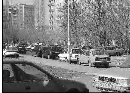
Budapest – Békásmegyer.