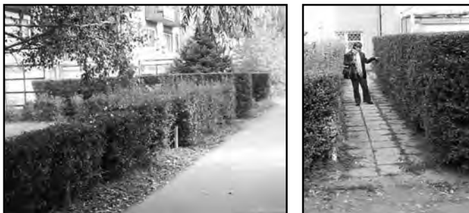
Budapest – Békásmegyér.