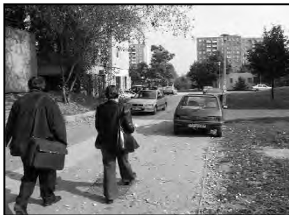
Budapest – Békásmegyér.