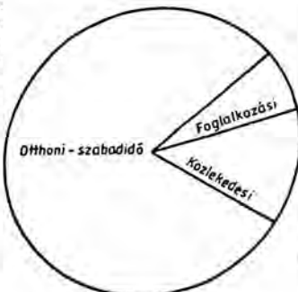
2. ábra. A balesetek fő típusai

Tudjuk, hogy külföldön a különféle baleseti típusok egymás közötti aránya nagyon hasonló a hazaiaké. Azt is láthatjuk (különösen az 1. táblázat alapján), hogy a baleseti típusok közötti megoszlás hazánkban hosszabb időn át is lényegében változatlan. Nemkülönben — az 1. és a 2. táblázat összehasonlítása során —, hogy a halottak és a sérültek egymás közötti aránya is közel állandó. Mindez feljogosíthat arra, hogy — mivel a közlekedési balesetek körében nemzetközi összehasonlításra van lehetőség — magyarországi és egyes külföldi országok közlekedési baleseti közötti összehasonlítás alapján vonjunk le következtetéseket az egész hazai (ezen belül is a nagy